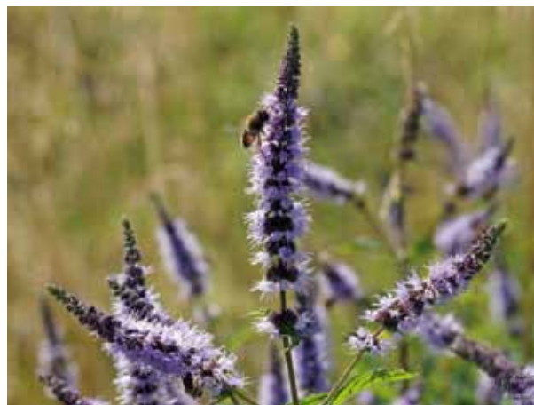
MENTHA VIRIDIS

Cette régulation dépend de facteurs biotiques liés au fond génétique des plantes et abiotiques tels que les conditions climatiques ou la nature du sol. Les HE produites par les menthes montrent ainsi des taux de menthol et autres monoterpènes variables (tableau 1). Cette variabilité s'illustre par la description de plusieurs chémotypes. Le chémotype peut être considéré comme l'empreinte chimique d'une variété ou d'une espèce. Il est associé à la